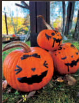
かぼちゃ協力：八ヶ岳中央農業実践大学校