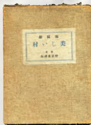
堀辰雄『美しい村』 (1934年、野田書房)