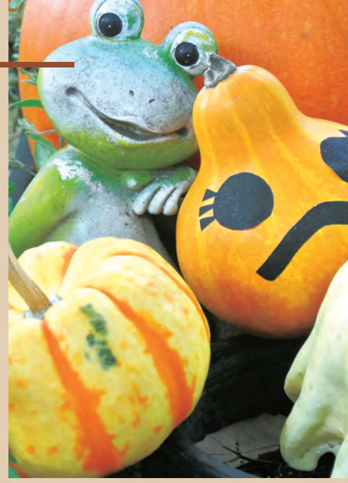
協力：ハヶ岳中央農業実践大学校

小学生以上対象で特典は合格者本人のみです。入園する際に仮装判定します。合格して入園された方は、行動に支障をきたさない限り退園まで仮装を脱ぐことはできません。雨天の場合など、ボート無料券は他の特典に変わることがあります。合格して入園された方は、行動に支障をきたさない限り退園まで仮装を脱ぐことはできません。雨天の場合など、ボート無料券は他の特典に変わることがあります。