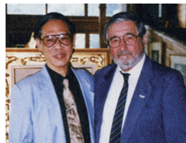
Portrait right ADAGP&JASPAR, Tokyo, 2014

料金 / 大人 900 円 小中生 500 円 (軽井沢タリアセン入園料含む)、軽井沢高原文庫・深沢紅子野の花美術館とのセット券大人 1500 円 小中生 800 円 20 名様以上 1 割引 各種割引あり 小学生未満無料