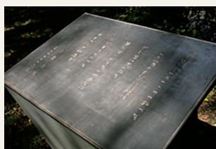
立原道造詩碑 軽井沢高原文庫前庭 設計・磯崎新

7 月 25 日 (金) ~ 9 月 30 日 (火) ※会期中無休 会場：堀辰雄 1412 番山荘（当館中庭）