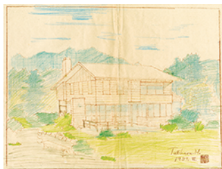
スケッチ 無題【豊田氏山荘外観】1938 年 6 月