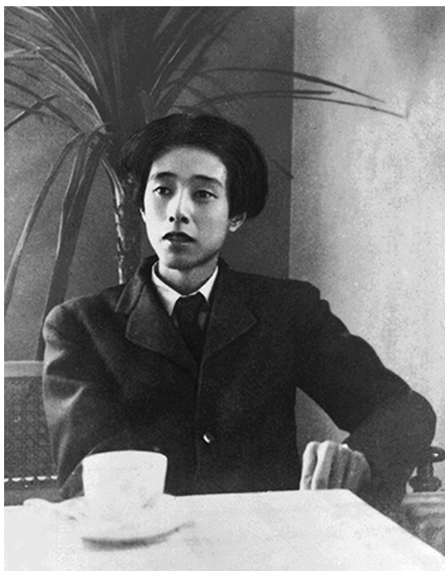
立原道造、銀座ニュー・トーキョウで 1938 年春

四季派の抒情詩人立原道造の生誕 100 年を記念し、「立原道造と軽井沢」展を開催します。立原道造は 1914 年、東京・日本橋橋町に生まれ、府立三中、旧制一高、東京帝大建築学科卒業、石本建築事務所に勤めました。その間、堀辰雄、室生犀星らと交友を深め、詩などの創作を続けましたが、病気のため 1939 年、24 歳 8 ヶ月で世を去りました。立原は、1934 年夏、堀辰雄に誘われて初めて軽井沢を訪れ、以来亡くなる前年まで毎夏続いた浅間山麓での<村ぐらし>を通じ、『萱草に寄す』『浅間山麓に位する芸術家コロニイの建築群』等の優れたソネットや建築作品を生み出しました。本展は立原の詩的世界を育んだ軽井沢において、立原と当地の関わりを中心に、彼の足跡を紹介するものです。詩稿、設計図、パステル画、書簡、著作、初出誌、建築模型など貴重な資料約 200 点を展覧します。