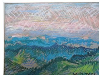
パステル画 1931 年頃