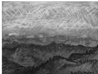
立原道造パステル画 1931年頃