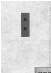
川端康成「高原」 1942年7月、甲鳥書林(秋山居・高原・美人競争・百日堂先生・父母・戸隠の巫女)装幀・堀辰雄