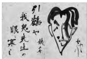
室生犀星「愛の詩集」出版記念会の寄せ書き 1918年4月頃 画・北原白秋(芥川龍之介の似顔絵)、句・芥川龍之介筆(「引鶴や我鬼先生の眼、寒し」)

「僕は歩いてみた 風のなかを」。堀辰雄は「詩集」の中で、そう記しました。今から130年前の1886年(明治19)、軽井沢はカナダ人宣教師によって避暑地として見出されました。以降当地は、文学者などからも愛される土地になり、様々な作品に描かれ、独特の文学風土を育んできました。緑豊かな自然や戦争の時代の社会情勢など、作家たちは時代ごとに各々の視線で当地を描写しています。今展では、明治から昭和までに発表された、優れた「軽井沢文学」をご紹介します。室生犀星、堀辰雄、川端康成、遠藤周作らを始めとする多くの作家たちが、小説や詩、随筆、俳句、短歌等ていかに軽井沢を描いたのか。原稿・書簡・絵画・初出誌・写真など約250点に及ぶ資料から、文学者の目で見た「130年の軽井沢」を展覧いたします。