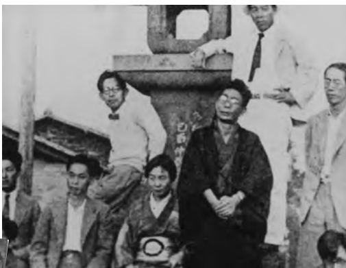
追分・分去れにて 昭和10年代 左から川端康成、堀辰雄、板垣直子、室生犀星、河上徹太郎、板垣鷹穂