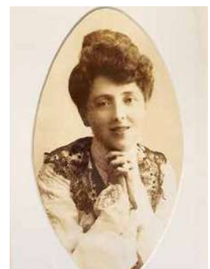
ルーシー・モード・モンゴメリ Lucy Maud Montgomery (1874-1942)

カナダの女流作家、ルーシー・モード・モンゴメリ作の小説『赤毛のアン』。世界一美しいと言われる島、プリンス・エドワード島を舞台に描かれる孤児アン・シャーリーの成長物語は、世界中で一世紀以上にわたり読まれ、多くのファンに愛されてきました。日本で初めて『赤毛のアン』を訳した村岡花子は、軽井沢をよく訪れた文化人のひとり。『赤毛のアン』ゆかりの軽井沢で、本格的な「赤毛のアン」の展示が開催されます。