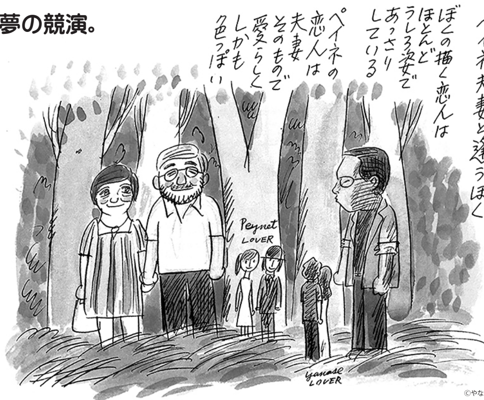
「詩とメルヘン」1986年11月号より(株式会社サンリオ)